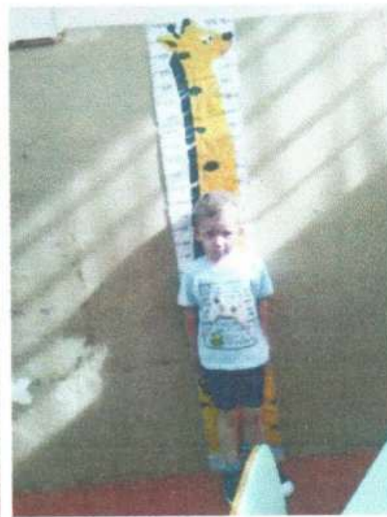
Essa é a minha casa Maternal 1A