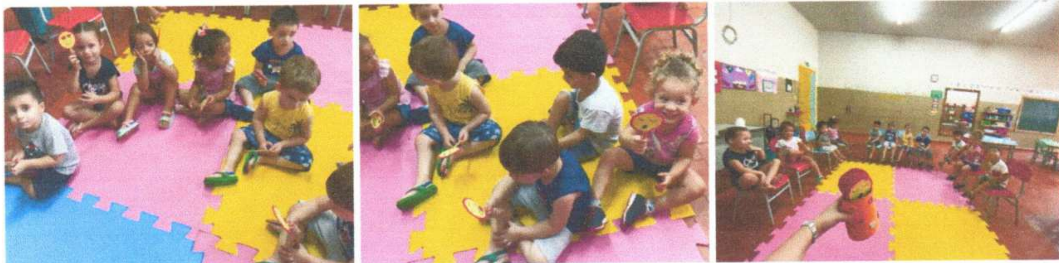
Brincadeira dirigida Caça ao rabo do cavalo Maternal 1A