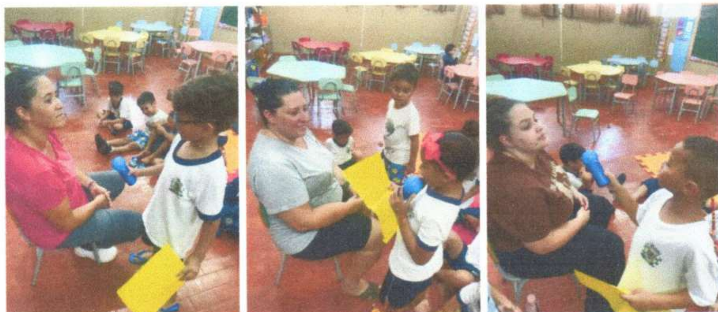
Roda de diálogo sobre os nossos sentimentos Estimulando a cooperação, interação e socialização entre os pares. Maternal 1B