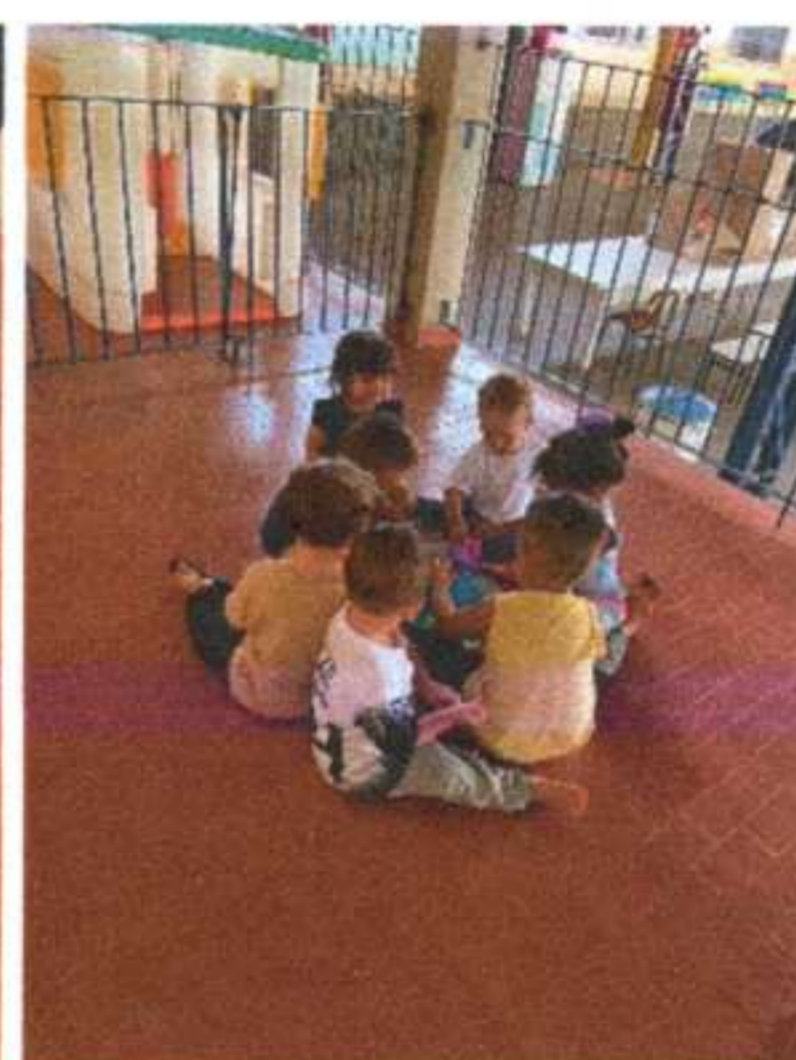
Confecção de um brinquedo :a peteca. Maternal 2B