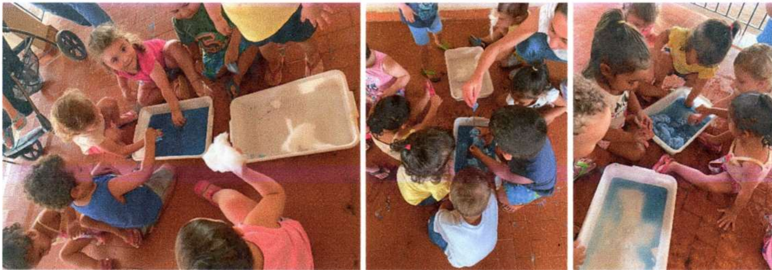
Finalizando o Projeto "Primavera" Apresentação da música: As árvores balançam. Trabalhando coordenação motora, atenção e imaginação. Pré 1 B