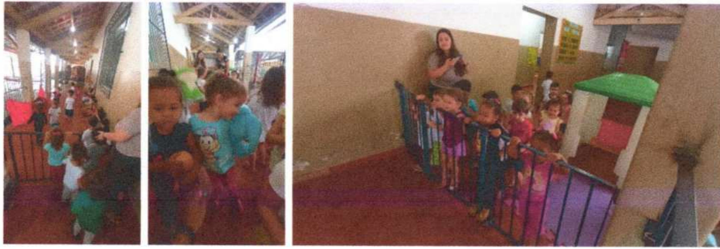
Confecção de máscaras e participação no Baile MATERNAL 2B