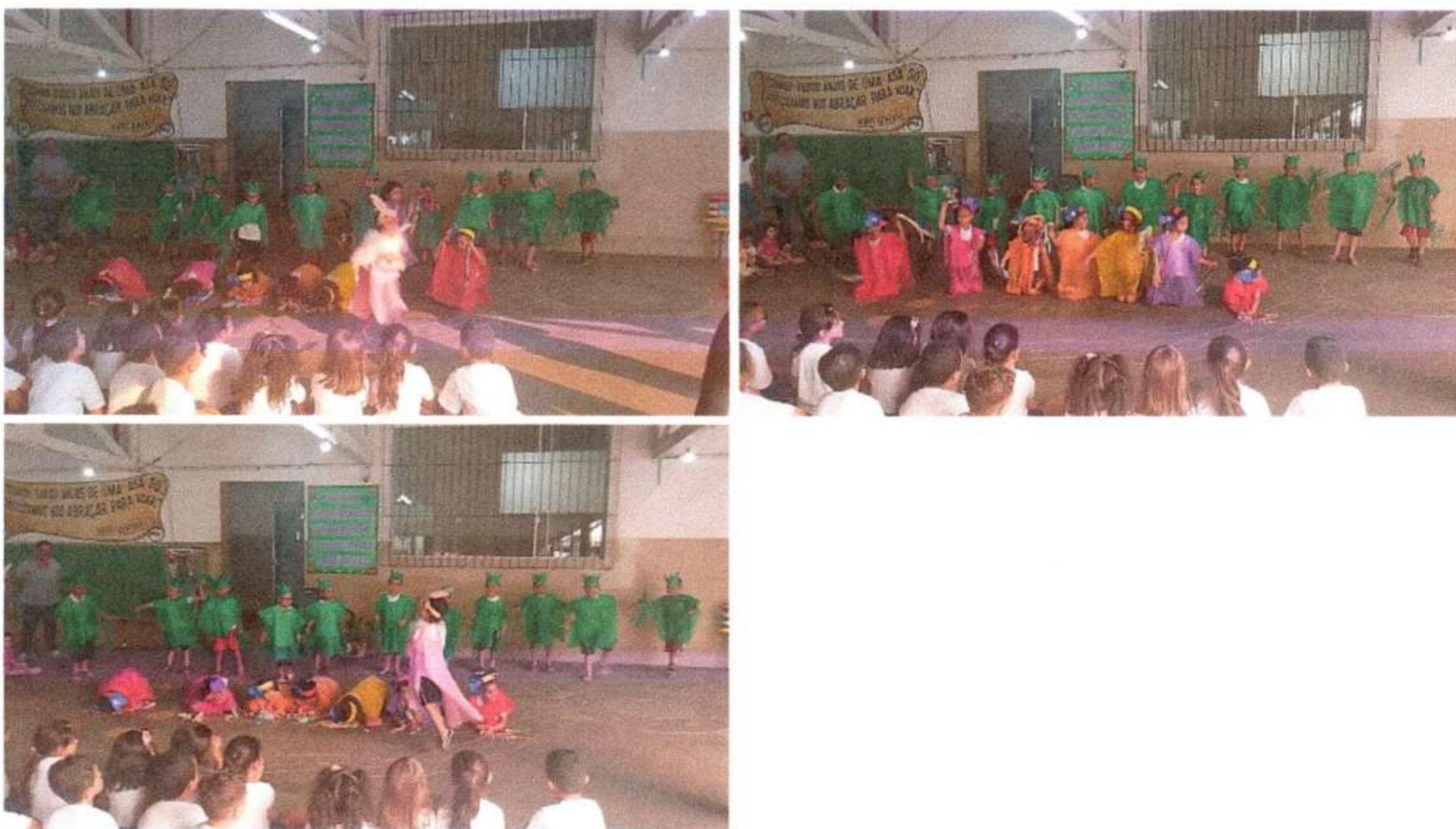
Término do projeto Primavera. Apresentação da Música A linda rosa Juvenil Trabalhando musicalização, atenção e imaginação Pré 1A