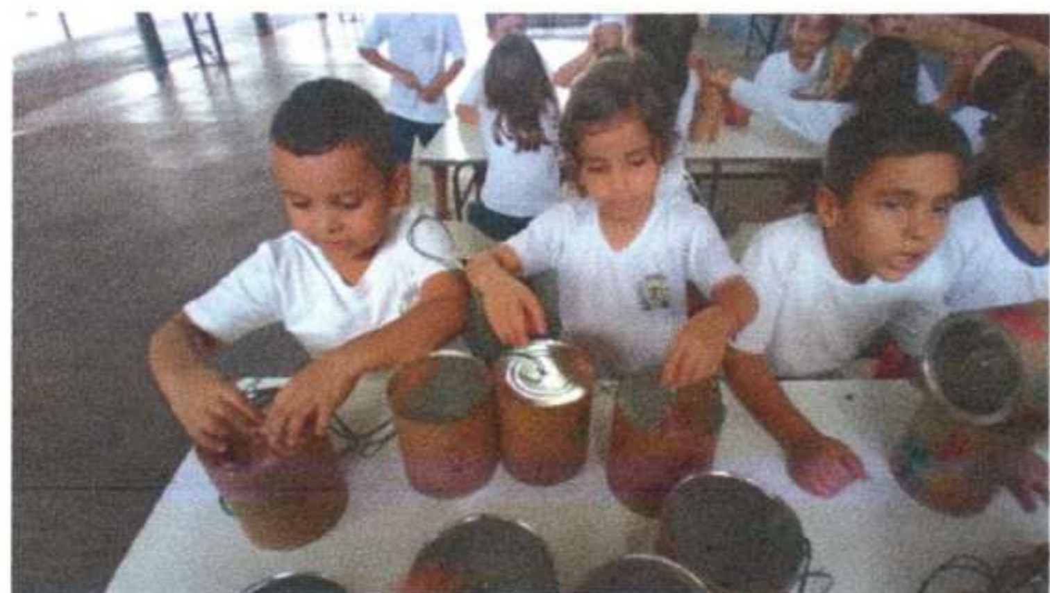
Confecção de um brinquedo: Pé de Lata Pré 2B