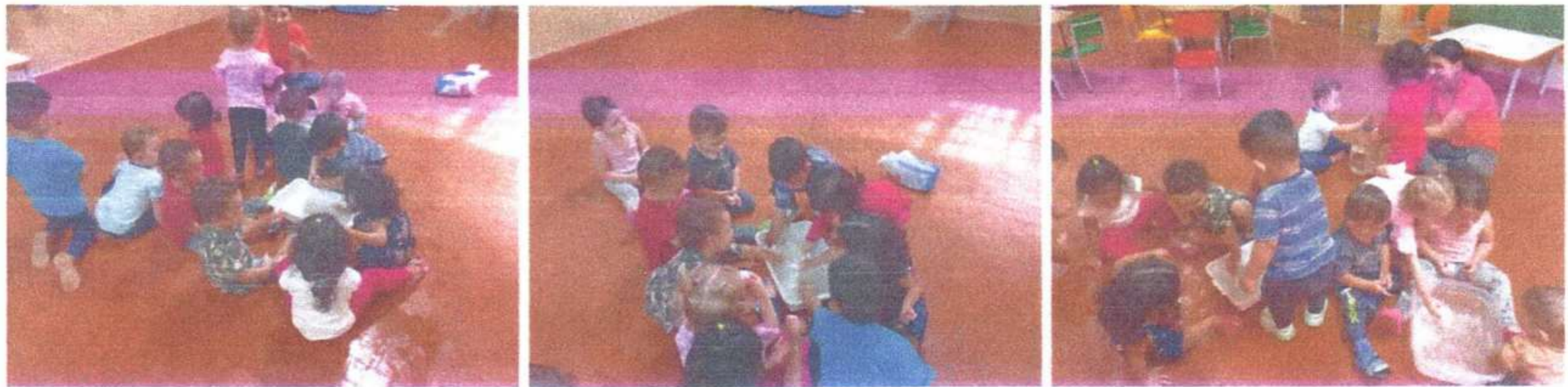
Brincando de fazer espuma divertida. Pré 2 A