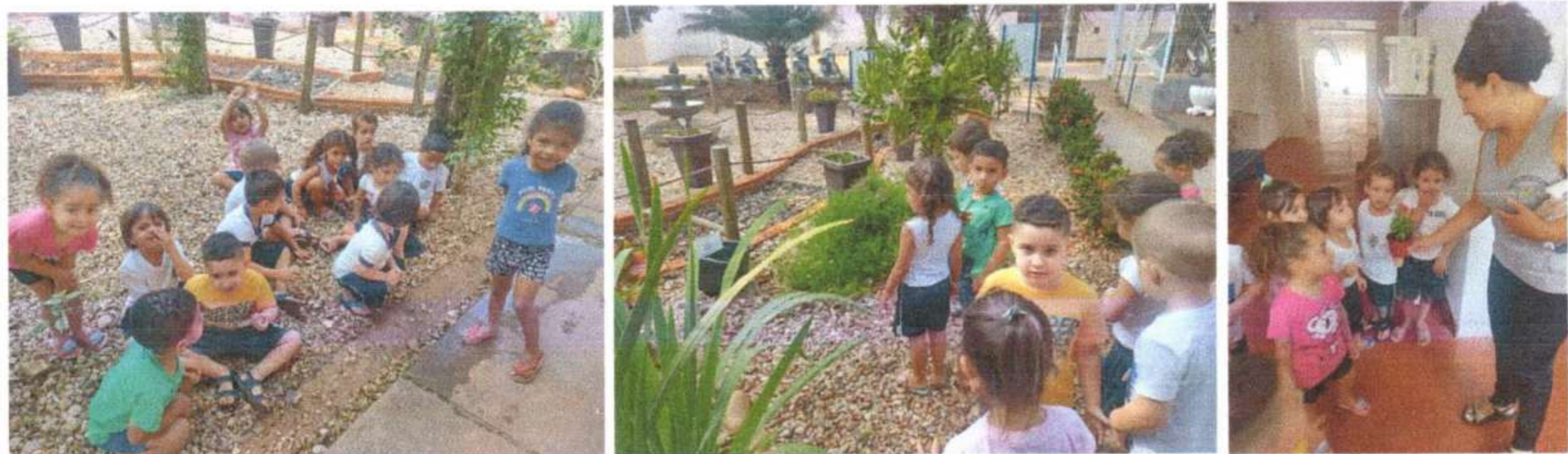
Caminhando ao redor da escola. Estimulando a criatividade, oralidade e curiosidade do que encontraram em torno da escola. Maternal 2 A