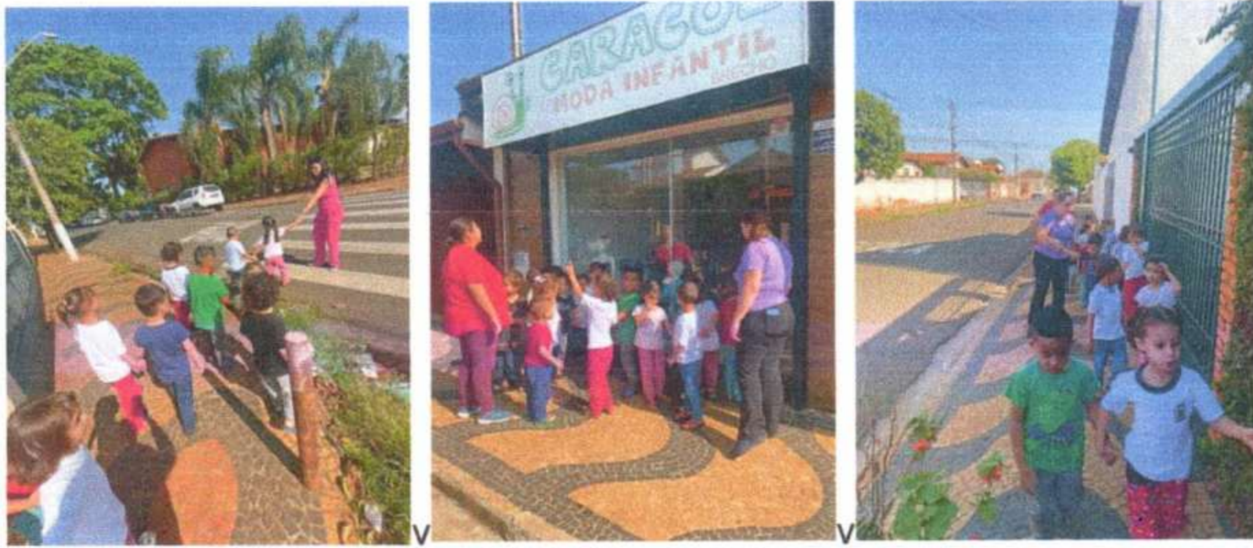
Caminhando pela escola. Explorando os ambientes e conversando com os funcionários. Maternal 2 A