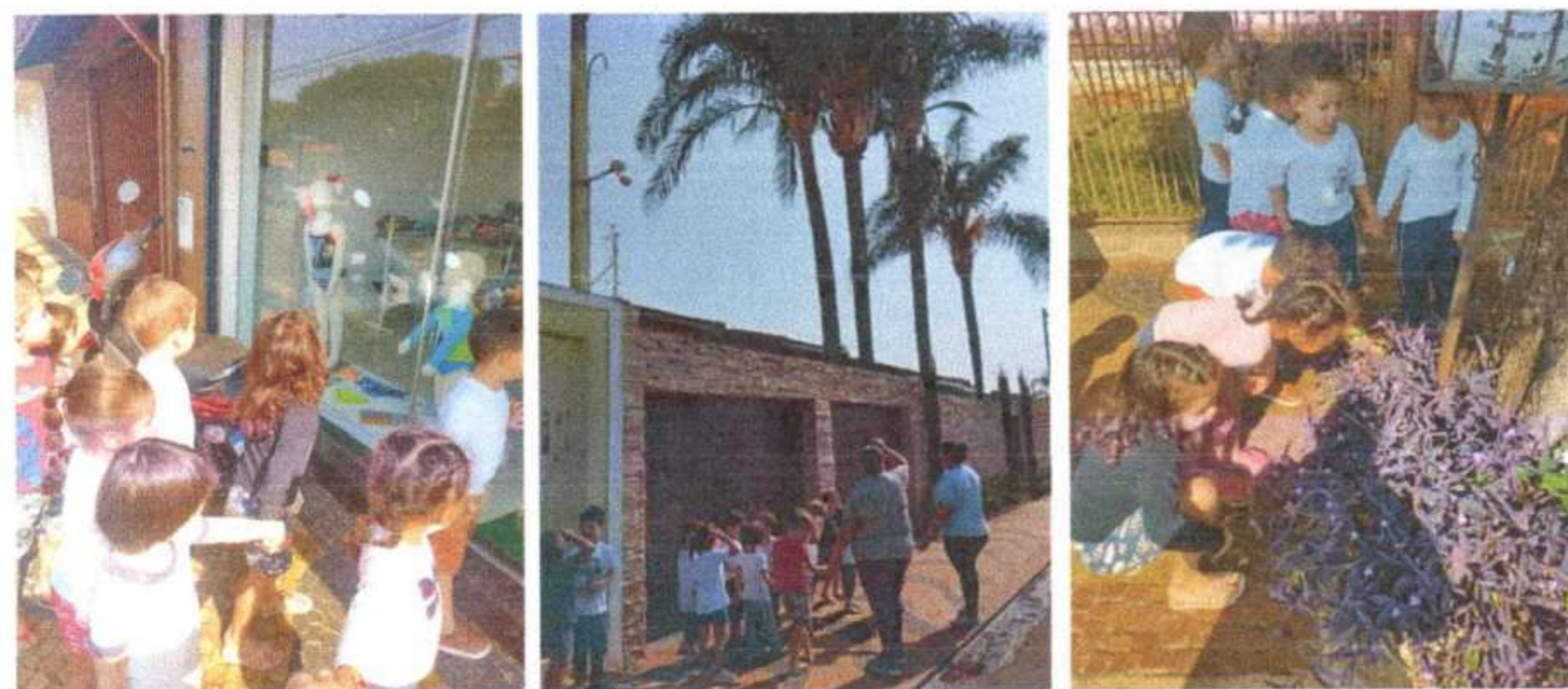
"Família/Escola parceria que dá certo" .