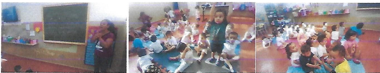
Dia 14/5 – As crianças e os animais Conhecendo os sons dos animais e imitando-os. Maternais 2 A e 2 B