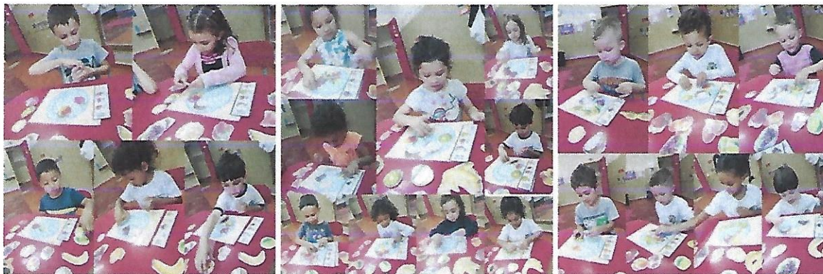
Dia 29/5 – Experiência “Boia ou afunda?” com uso de diferentes tipos de pedras e outros objetos. Estimulando a percepção de pesos, densidade, texturas e quantidades. Pré 1 B